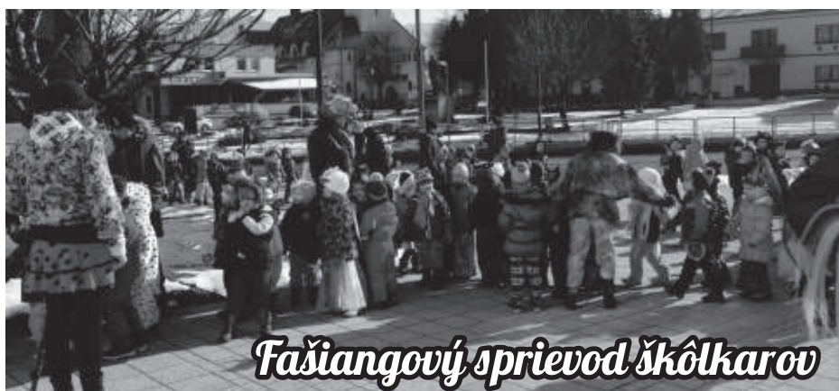
Fašiangový sprievod škôlkarov

Fašiangy sú krásna chvíľa, muzika nám vyhráva. Z dievčatka sa stane víla, motýľ, hviezda, púpava.