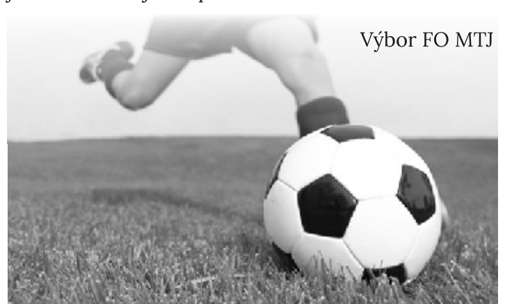
Výbor FO MTJ

Muži: Mužstvo začalo súťaž výhrou u konkurenta na postup. Tu je to trochu zložitejšie s dochádzkou na tréningy. Máme veľa vysokoškólakov, hráčov čo pracujú na smeny a niektorí podnikajú. Napriek tomu je dochádzka na slušnej úrovni. Tréningy pod vedením skúseného trénera sú pestré a kreatívne. Po odohraní štyroch kôl má mužstvo bilanciu dve výhry jedna remíza a jedna prehra so skóre 5:3.