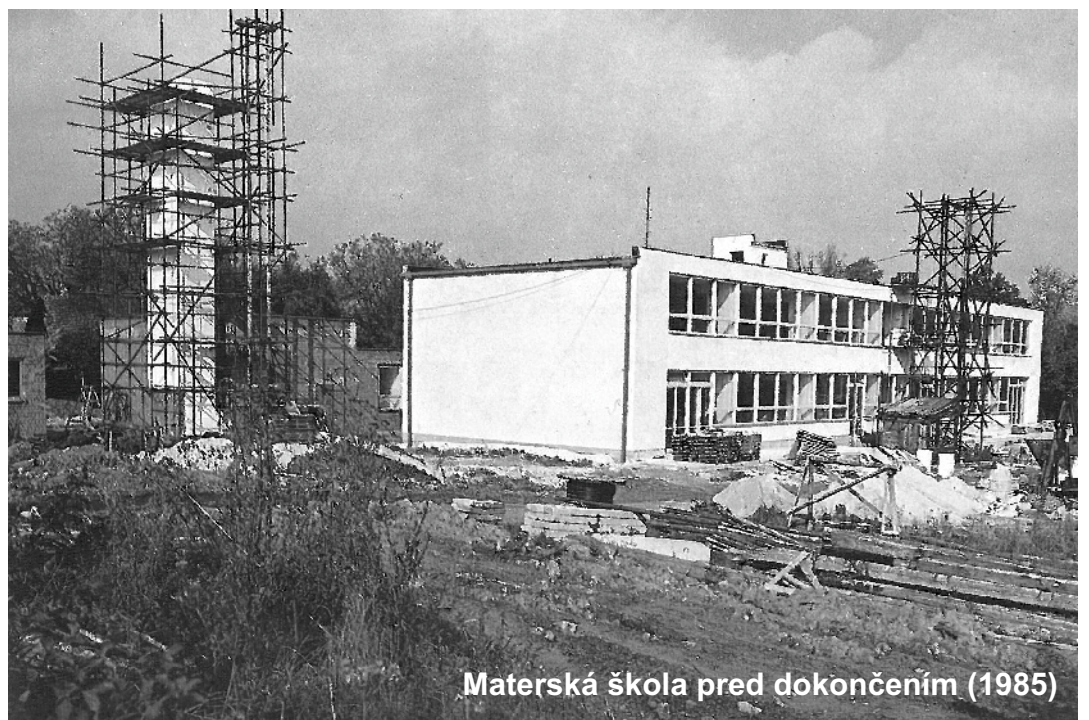
Materská škola pred dokončením (1985)