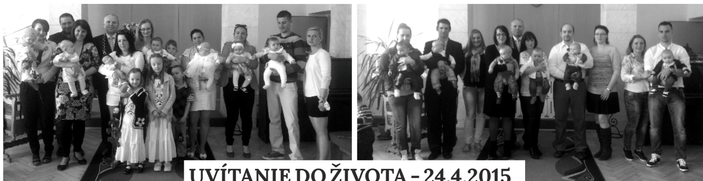
UVÍTANIE DO ŽIVOTA - 24.4.2015

Všetkým našim malým občanom a občiankam prajeme veľa šťastia do života.