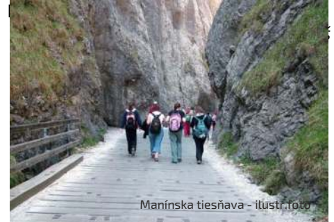
Manínska tiesňava - ilustr. foto

Informácie na t.č. 046/544 65 02, 0902 558 819